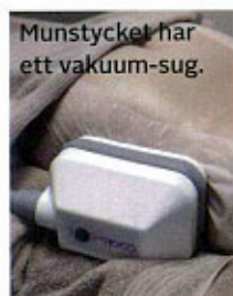
Munstycket har ett vakuum-sug.

–Byxorna jag ofta använde i somras sitter inte alls lika tajt i midjan och det väljer inte över linningen längre. "Ryggvecken" är nästan helt borta.